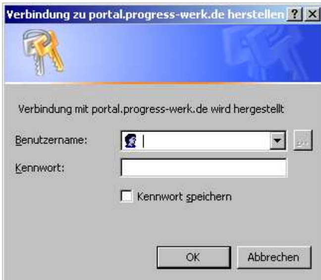
Abbildung 2 : Falsches Anmeldefenster erscheint

Bei Benutzen des Internet Explorers kann ein solches Anmeldefenster erscheinen (Abbildung 2)