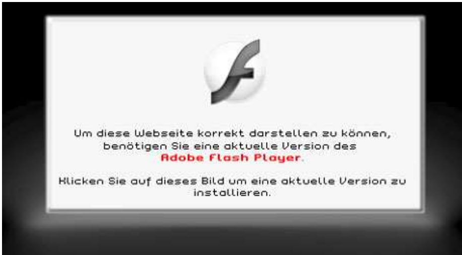
Abbildung 1 : aktuelle Version des Flash Player

Wenn diese oder eine ähnliche Fehlermeldung beim Aufruf des Portals erscheint (Abbildung1), dann brauchen Sie auf Ihrem PC eine aktuelle Version des Adobe Flash Players.